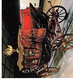
明治神宮ミュージアム 無料拝観