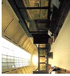
外苑聖徳記念絵画館 無料拝観