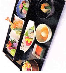
境内レストラン「よよぎ」、 明治記念館のお食事代割引

※掲載の会員特典は一例です。待遇を受ける際には会員証をご提示ください その他、様々な企画を随時開催しております