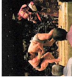
全日本力士選手権大会 観戦ご案内