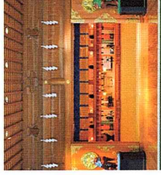
明治神宮神楽殿 昇殿参拝