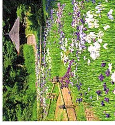
御苑、清正井 無料拝観